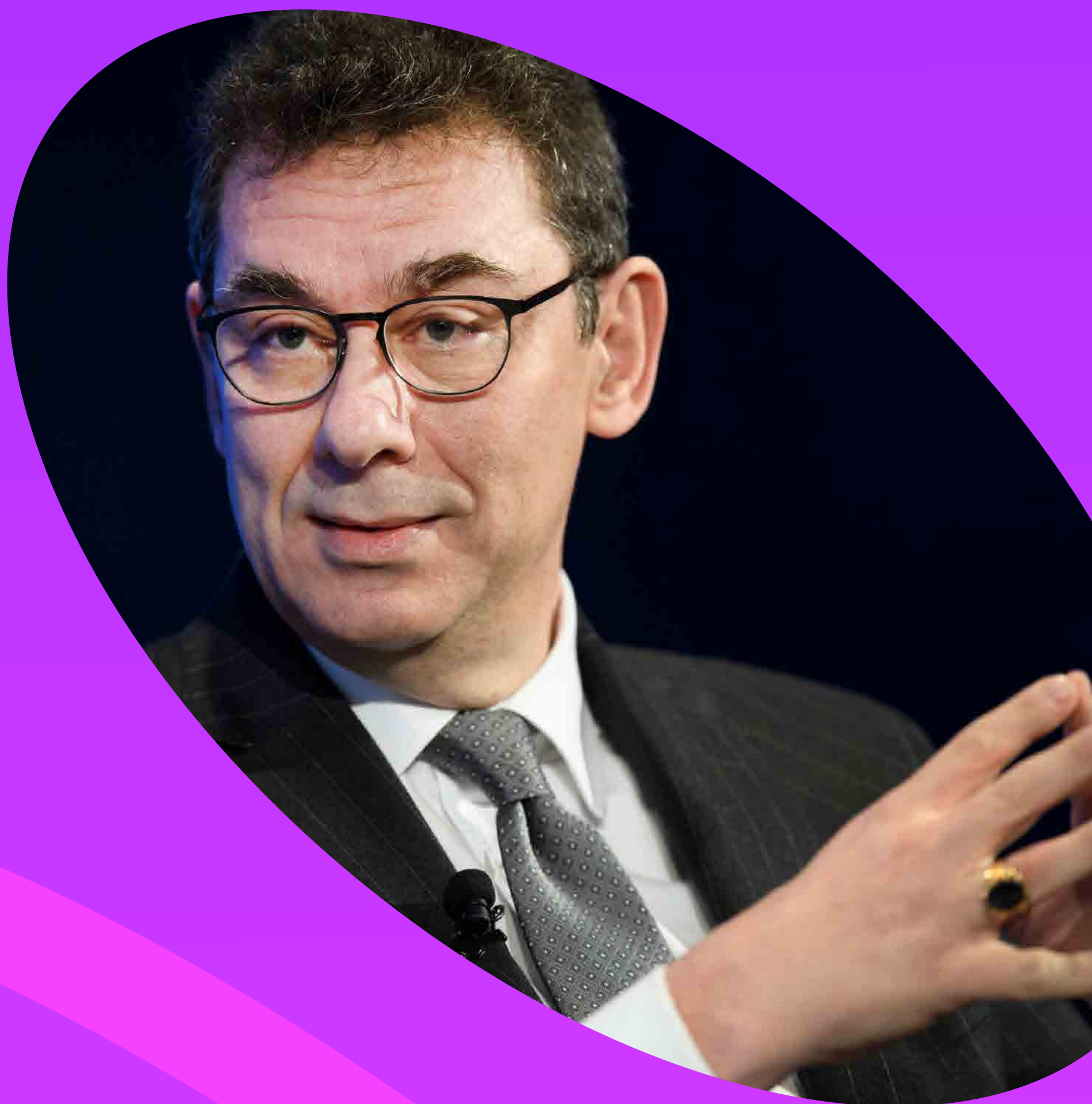
Dr. Albert Bourla